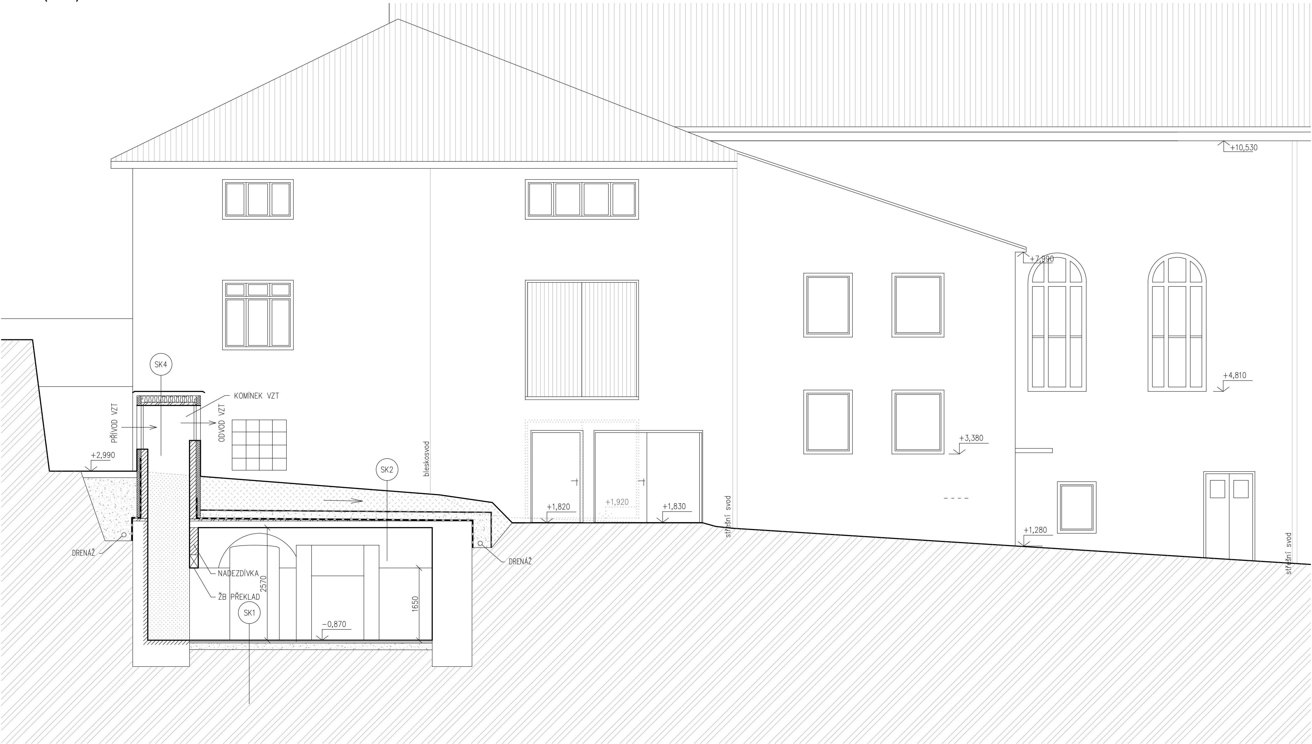
ŘEZ B-B (M 1:50)